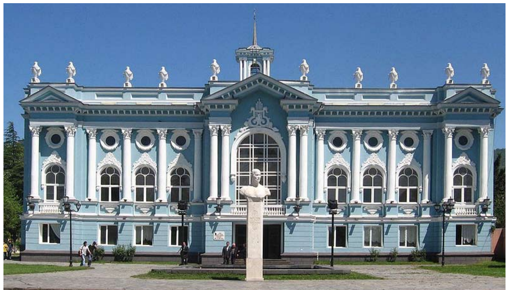
تەلاری شانۆ لە جۆرجیا