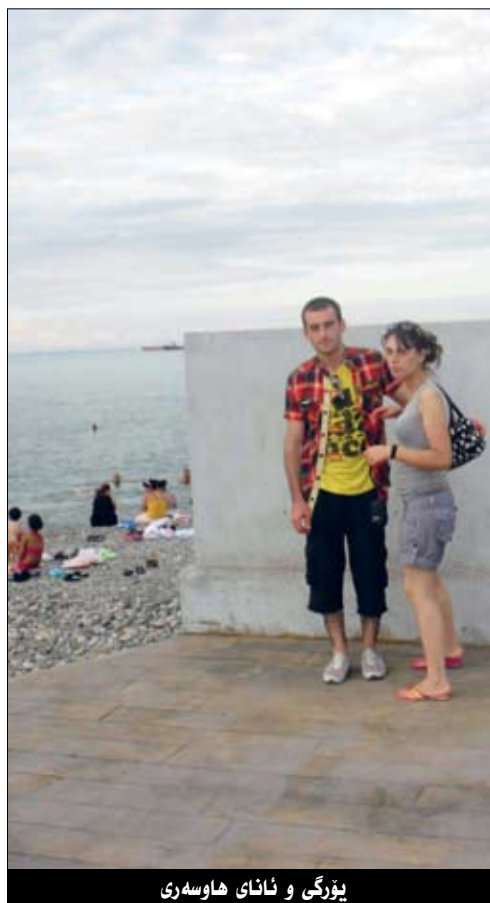
يۇرگى و ئاناي ھاوسەرى