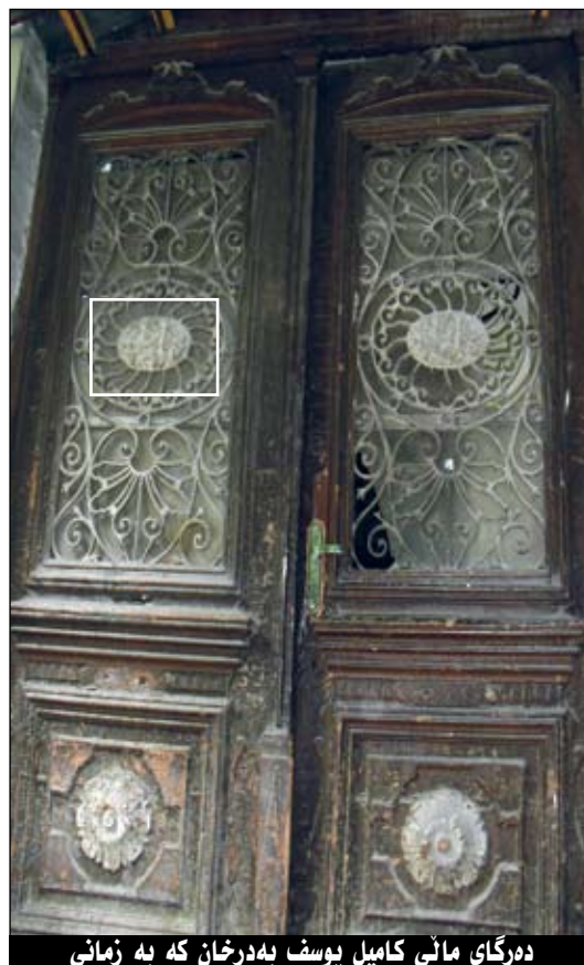
دهرگاى مائى كاميل يوسف بەدرخان كه به زمانى فارسى لهسهه نووسراوه